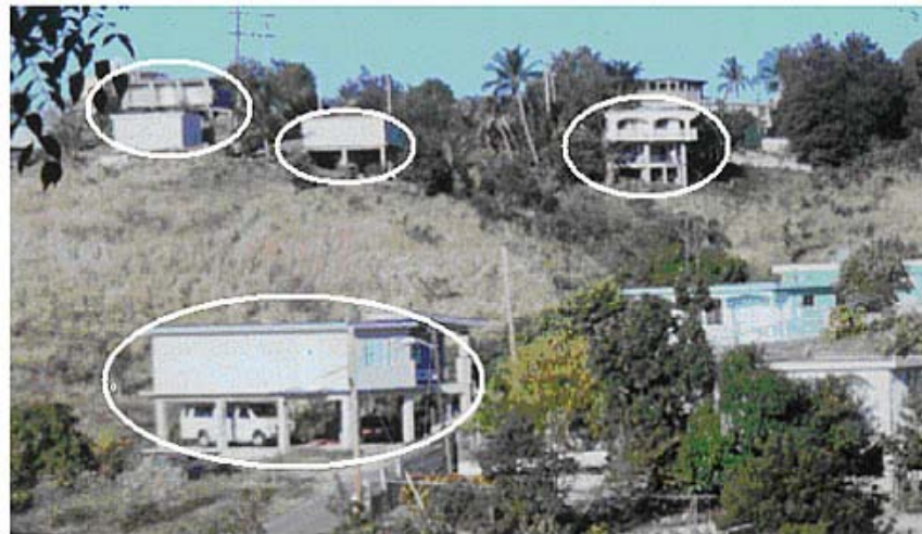
RESIDENCIAS TÍPICAS CONSIDERADAS EN EL ESTUDIO

La investigación a que se refiere el artículo está destinada a estudiar el comportamiento y la rehabilitación sísmica de residencias típicas localizadas en laderas o terrenos escarpados y soportadas por columnas gravitatorias en Puerto Rico. La geometría típica para el análisis se obtuvo por muestreo de datos levantados a través de la isla. Debido a la topografía irregular en donde están localizadas las viviendas, el análisis sísmico fue efectuado tanto con parámetros estándares de diseño como con la inclusión de la amplificación sísmica provocada por la irregularidad de la topografía. Se efectuaron análisis no lineales mono-tónicos y dinámicos transitorios. Se emplearon varios indicadores de falla. Además, se proporcionan recomendaciones mínimas para una rehabilitación sísmica confiable.