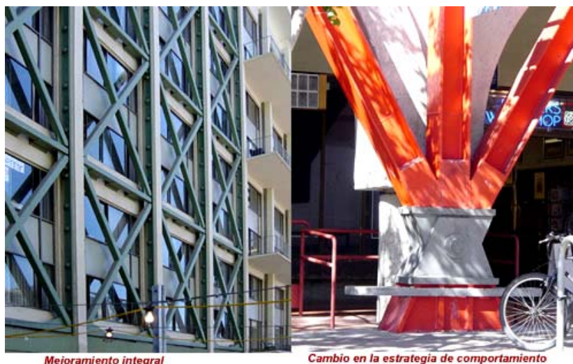
EJEMPLOS DE MEJORAMIENTO SÍSMICO