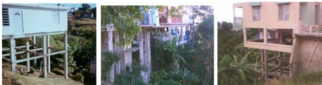
SISTEMA TÍPICO DE RESIDENCIAS EN LADERA Y COLUMNAS ESBELTAS